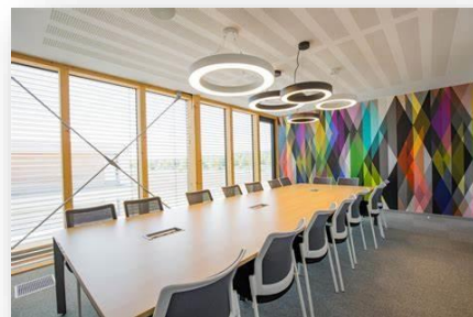
Nos locaux à Norroy-Le-Veneur